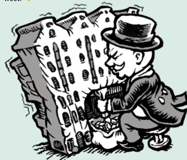
ILLUSTRATIE: ERIK VAN OPHEM

Het is een grote schande en het is maar dat u het weet. 🐾