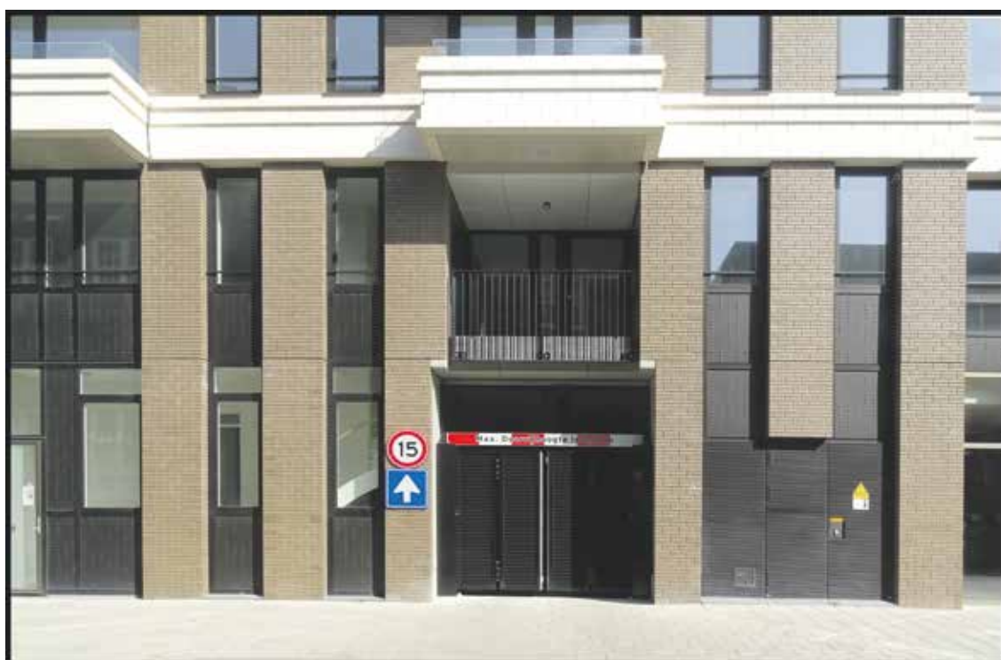
26 maart 2022