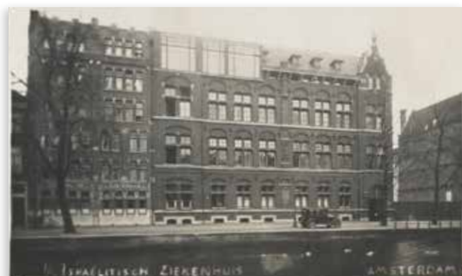
Het Nederlandsch-Israëlitisch Ziekenhuis (NIZ)