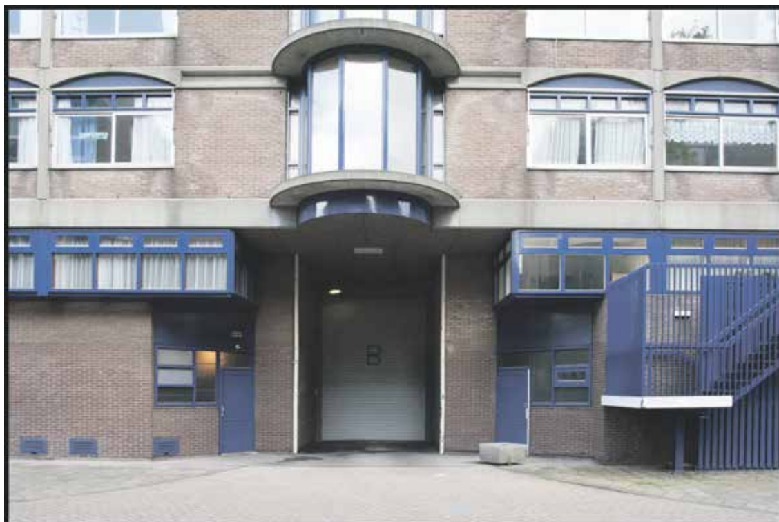
5 mei 2015

de kont van het gebouw, zeg maar gerust een multifunctionele cloaca: aan- en afvoer van goederen, werklui en auto's. Het is een gemiste kans om hier een leuke plint met publieksfuncties in te richten en de gewilde Plantage Muidergracht erbij te betrekken. 🌀