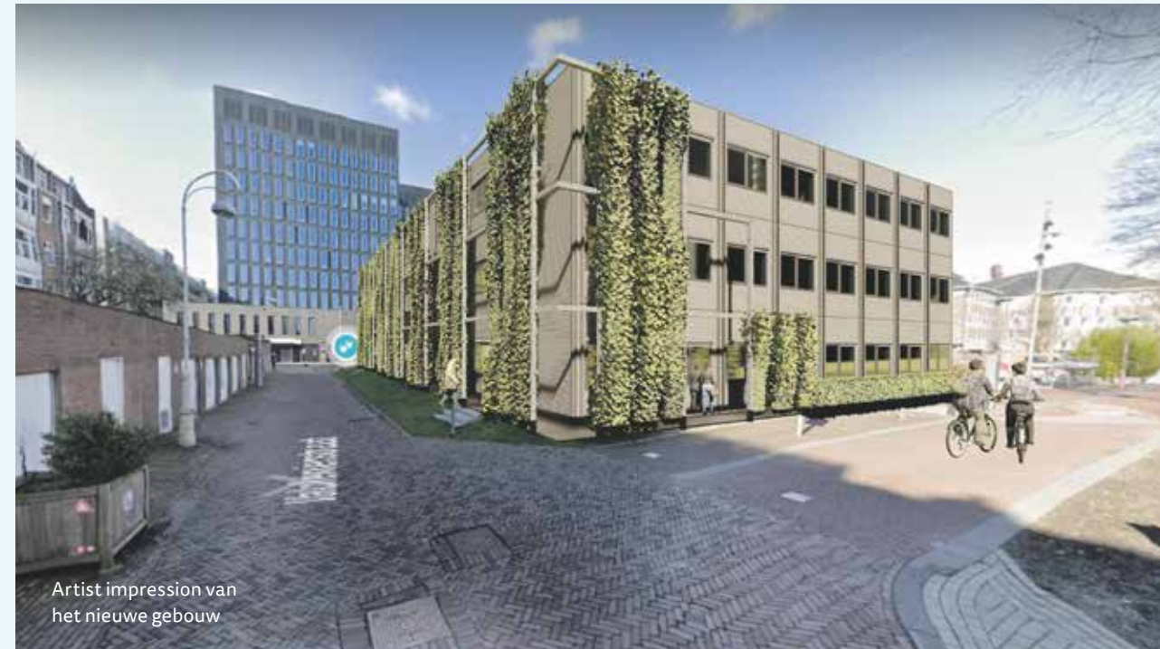
Artist impression van het nieuwe gebouw

daarom voor de hele stad een groot-schalige bodemsanering gepland. Begonnen wordt binnenkort op het Prinseneiland. Wanneer de Oostelijke Eilanden aan de beurt zijn, is nog niet bekend.