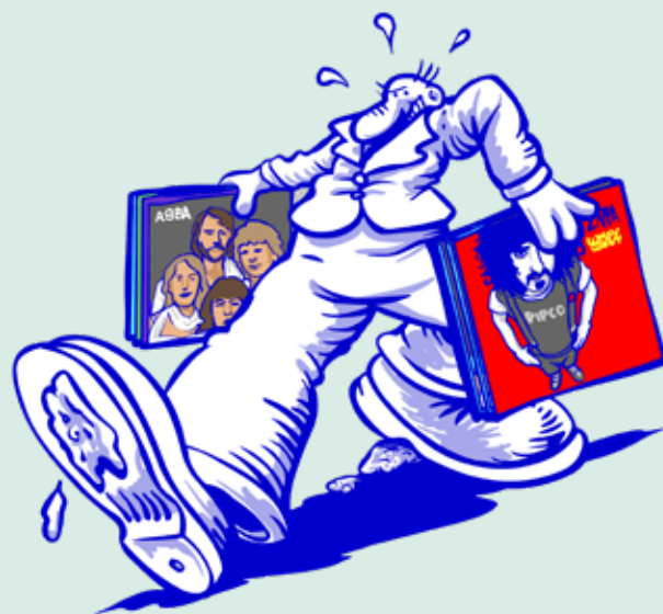
ILLUSTRATIE: ERIK VAN OPHEM

En daar gingen mijn vinylplaten, weg van de Kadijken, weg uit postcode 1018, de wijde wereld in. Op weg naar een nieuw baasje. Ik pinkte een traantje weg van circulair geluk en blijdschap en het is maar dat u het weet. ☺