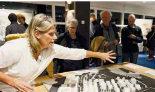
Eind november vond een infoavond plaats

Op het Marineterrein komen ongeveer 800 woningen en 2.300 werkplekken. Rond de zomer adviseert stadsdeel Centrum over de projectnota met daarin de nota van uitgangspunten, de nota van beantwoording (met de inspraakreacties) en de participatieparagraaf. Lees de planning op www.amsterdam.nl/projecten/marineterrein .