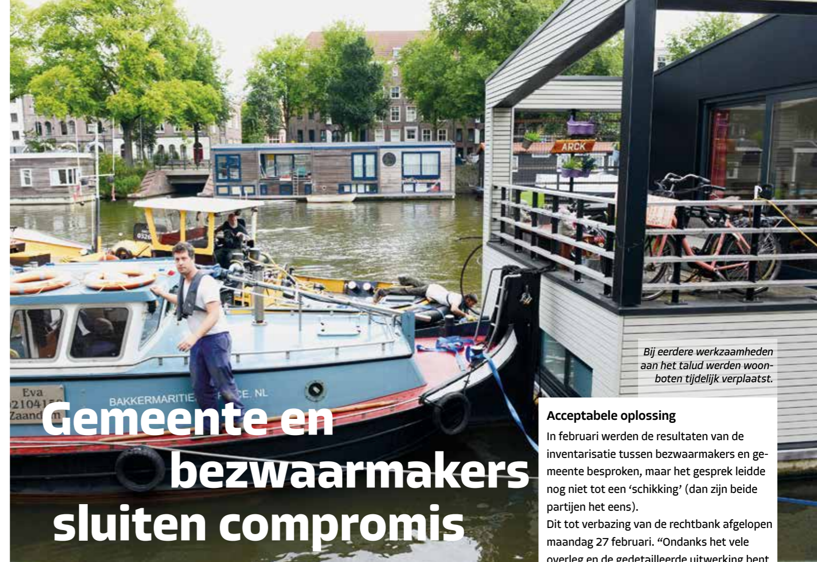
Bij eerdere werkzaamheden aan het talud werden woonboten tijdelijk verplaatst.