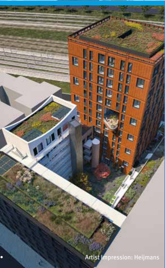
Artist Impression: Heijmans

Inmiddels zijn de restaurateurs ook begonnen met de oudste gevel, aan de kant van het water met de meeste weersinvloeden. “Een beetje de hoofdpijnhal”, zegt Bart. “De kraan in die hal liep telkens tegen de eindstoppen aan. Door de klap en trillingen die dat veroorzaakte, lagen sommige balken alleen nog maar in het cement. In die gevel zit veel oud ijzer. Van de ijzeren draadeindes is soms nog maar twintig, dertig procent over – de rest is roest. Maar goed, we zijn over de helft. Eind eerste kwartaal 2023 klaar zijn met de buitenmuren zou heel mooi zijn.”