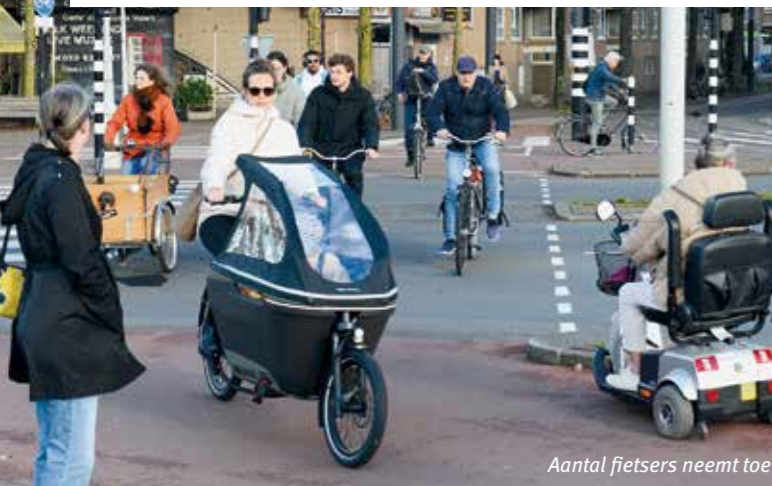
Aantal fietsers neemt toe

De Czaar Peterstraat wordt opnieuw ingericht. Dit in het kader van het project Binnenring; dit is een ruim zeven kilometer lange, comfortabele, doorgaande route (vanaf Haarlemmerplein-Marnixstraat-Weteringschans-Sarphatistraat-Czaar Peterstraat) voor fiets en openbaar vervoer. De verwachting is dat het aantal fietsers en de frequentie van het openbaar vervoer toenemen. Daarom wordt de inrichting van de hele Binnenring aangepast.