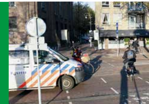
Kruising tegenover de Oosterkerk

“Er is destijds bij de inspraak gezegd dat de infrastructuur voor de verkeerslichten zou blijven. Mocht het kruispunt