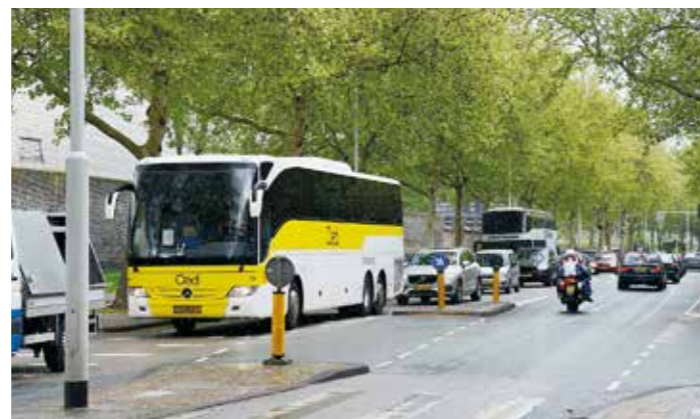
Plantenbakken blijven staan om touringcars te weren

Met de beleidsnota geeft Amsterdam gehoor aan de Verklaring van Stockholm. Deze werd in 2020 o.a. door Nederland mede onderkend in Zweden tijdens een conferentie met 140 landen over verkeersveiligheid. Onderdeel van deze verklaring is de invoering van een maximumsnelheid van 30 kilometer per uur in bebouwde gebieden waar voetgangers, fietsers en auto’s zich mengen. In Brussel, Parijs en Helsinki is 30 kilometer al een feit. De reacties zijn positief.