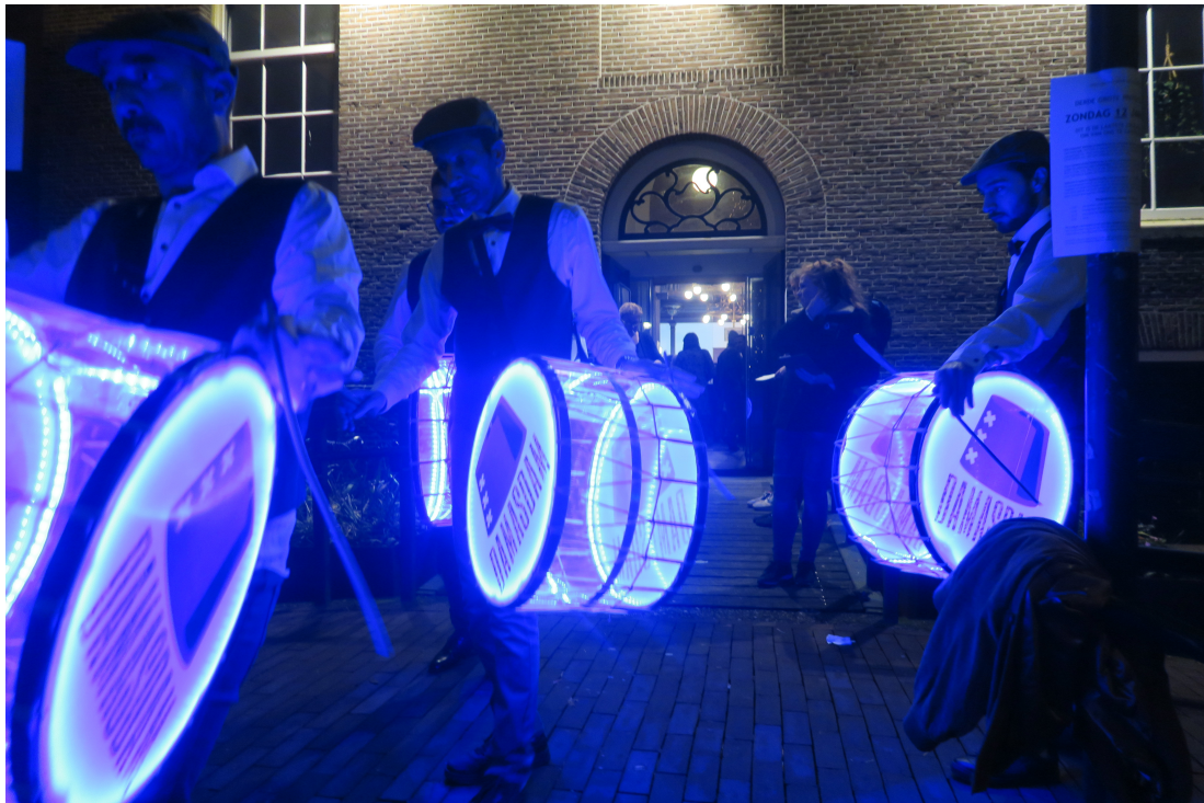
Syrische Muziekgroep Damasdam