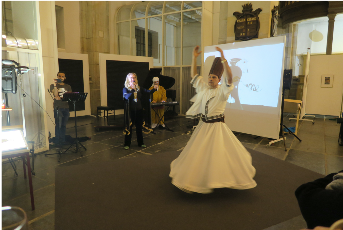
Show 'Tussen Hemel en Aarde' met Derwisj-dans