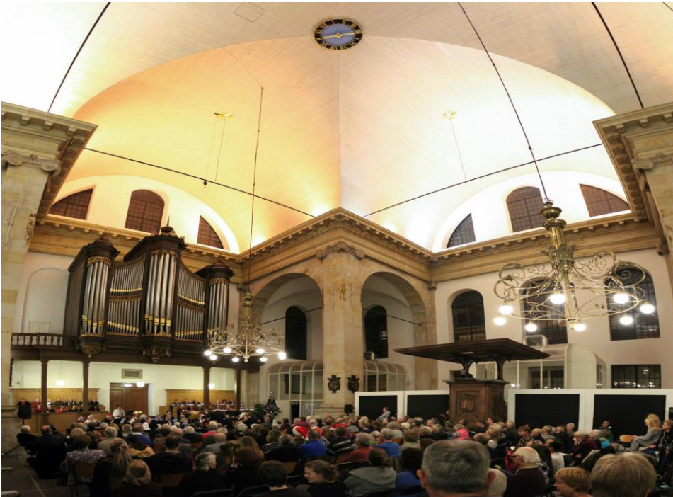
Kerstconcert Muziekgezelschap Wittenburg, 22 december 2017

1x Kerstconcert: Muziekgezelschap Wittenburg gaf samen met het Eilandenkoor/Vierwindenkoor een gratis kerstconcert.