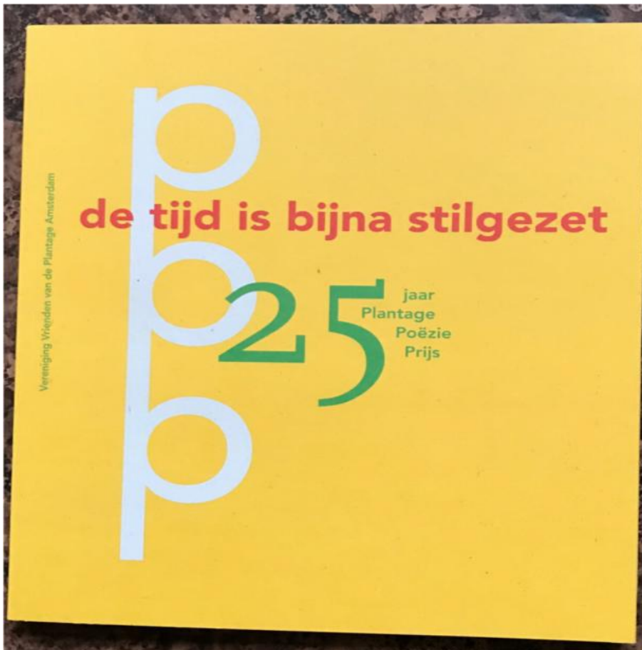
Boekje 25 Jaar Plantage Poëzie Prijs

Na een gloedvol Tango-intermezzo van gastheer en gastvrouw van de Salon, volgde de presentatie van de door de Vrienden van de Plantage uitgegeven poëziebundel De tijd is bijna stilgezet. 25 Jaar Plantage Poëzieprijs . Deze bundel bevat 25 jaar winnaars van de Plantage Poëzieprijs. In de aanloop naar de productie is er voor gekozen om de kunstwerken die de prijswinnaars elk jaar ontvangen af te beelden bij het gedicht. Alle kunstwerken waren door kunstenaars uit de Plantage gemaakt en de bundel is daarmee tegelijkertijd een bescheiden staalkaart van 25 jaar kunst in de Plantage. Vanuit het hele land waren dichters van die afgelopen 25 jaar naar 'hun' presentatie gekomen en drie van hen mochten de eerste exemplaren in ontvangst nemen. Inge Boulonois, René van Loenen en Marieke van Leeuwen droegen vervolgens uit recent eigen werk voor. Marieke van Leeuwen deed dat in een enthousiaste voordracht met Nick McGuire als muzikale begeleider. Grafisch ontwerper Lies Ros werd door Cees van Ede geïnterviewd over de vormgeving van de bundel, waarin naast de winnende gedichten ook alle prijs uitgereikte kunstwerken zijn opgenomen. Behalve een dichtbundel is het boek zo ook een staalkaart van kunstenaars uit de Plantage geworden.