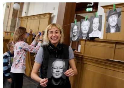
Een vrijwilligster hangt foto's op tijdens de voorbereiding van de lancering.

Ca. 275 bezoekers waarvan 90 nieuwe deelnemers uit de buurt ondersteund door 20 vrijwilligers uit de buurt tussen 12 en 70 jaar.