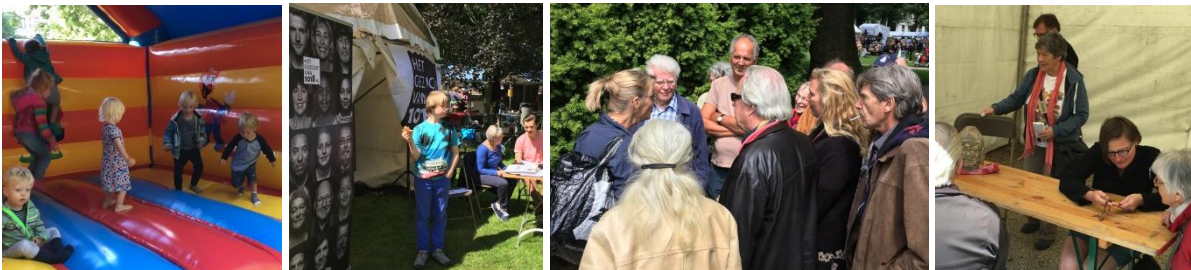
het kindercircuit, de informatiemarkt, de hapjes en de drankjes en de ijsjes...