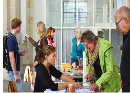
De eerste deelnemers van de fotodag melden zich.