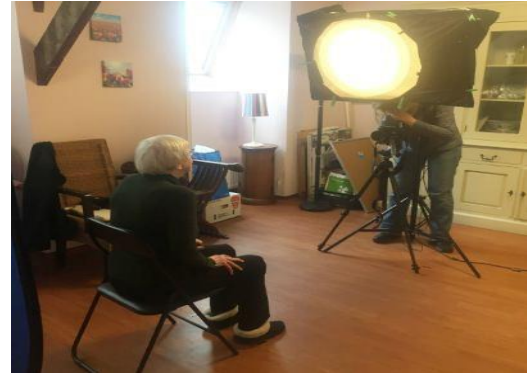
De oudste deelnemer aan het project (99 jaar) gaat op de foto