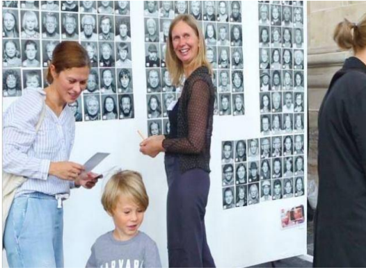
Een moeder haalt de foto van haar gefotografeerde kind op.