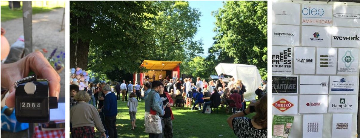
Er was voor iedereen wat te doen, de kunstboulevard, de verlichting, de silent disco,