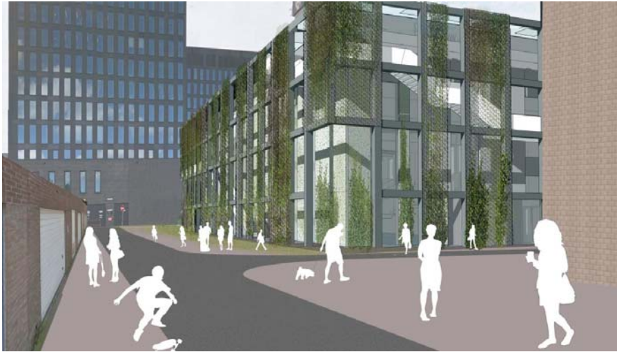
Nieuwbouwplan collegezalen UvA op grasveldje Roeterseiland

Het plan van de UvA om op een grasveld achter de Sarphatistraat een nieuw onderwijsgebouw neer te zetten, zorgde maandag op een door de universiteit georganiseerde bewonersavond voor woedende reacties. De omwonenden voorzien een ernstige aantasting van hun woongenot als er pal achter hun huizen een 'zwarte doos' met een hoogte van vijftien meter wordt neergezet.