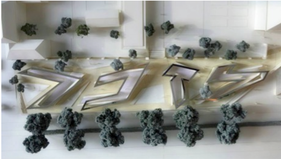
Holocaust Namenmonument aan de Weesperstraat.

De Plantage Weesperbuurtvereniging, de Bewonersvereniging Studentenflat Weesperstraat, de Stichting de Groene Plantage, de Stichting tussen Amstel en Artis en een aantal omwonenden maken bezwaar tegen de omgevingsvergunning voor het Namenmonument en tegen de kapvergunning voor 25 bomen. Op 7 februari 2018 hebben zij hun bezwaar ingediend en op 14 maart zijn daarvoor de gronden aangevoerd met een groot aantal bijlagen.