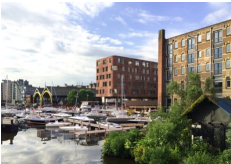
Artist impression woongebouw op het werfterrein.

Scheepswerf Koning William (Hoogte Kadijk 145B) houdt ermee op. Ontwikkelaar Hubstudios gaat op het werfterrein een woongebouw op poten neerzetten van vijf verdiepingen. Bootservice Amsterdam realiseert een jachthaven voor 60 kleine bootjes in het water van de Nieuwe Vaart met een werkplaats onder het woongebouw.