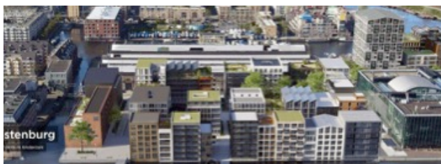
SOO-plan gezien vanaf de Oostenburgervaart

Er komt een parkeergarage van minimaal 2000 m2. De ontwikkelaar verdriedubbelt het aantal parkeerplaatsen door mechanisch parkeren in drie lagen per verdieping toe te passen. Dan passen er 160 auto's in.