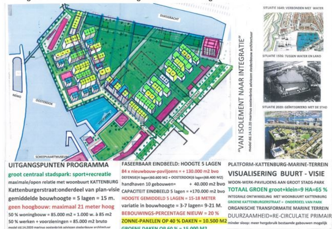
Buurtvisie Centraal Park met paviljoens , gemiddelde bouwhoogte 18 m., door Marinus Oostenbrink

Het Buurtplatform Kattenburg-Marineterrein heeft op 3 december zijn standpunt bepaald over de uitgangspunten voor de ontwikkeling van het Marineterrein. Het Platform is geschrokken hoe vol en hoe hoog de gemeente het terrein wil bebouwen ( zie de huis-aan-huis verspreide informatiekrant ). Behalve de Voorwerf en een sportveld zijn er slechts reepjes groen. De strokenbouw heeft geen enkele relatie met de huidige