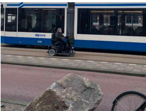
Mevrouw op scootmobiel neemt toevlucht op tram-baan omdat de rijbaan niet vrij is i.v.m. een levering.