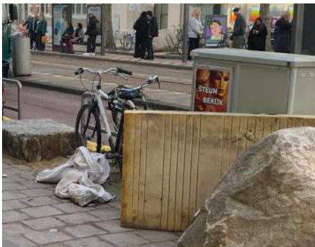
Fietsen chaos en rommel. Chaos trekt chaos aan.