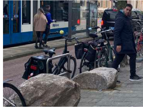
Uitgestapt uit de tram, over steen geklommen om veilig op het trottoir te geraken.