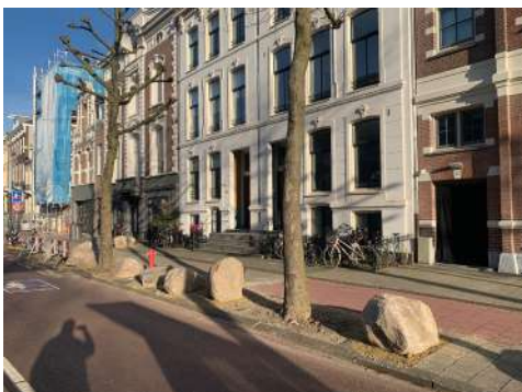
Ingesloten panden 23 en 25. 7 woon en werk-appartementen, 16 mensen. Vrije plek voor stadsgidsen met groepen. Hangplek.