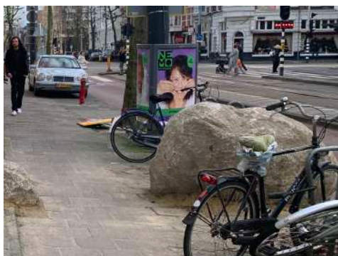
Fietsen chaos en rommel, nauwe doorgang.