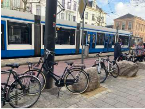
Fietsen en zwerfkeien blokkeren samen veilige overstek vanuit tram, mensen klimmen over de stenen, zie rechts op foto.