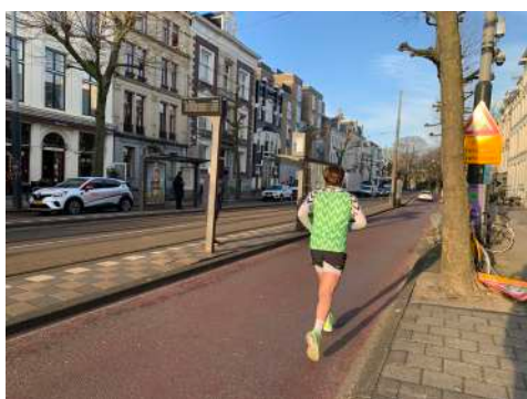
Geen vrije doorgang trottoir, hardlopen op de gedeelde fiets en autostraat.