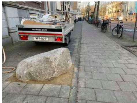
Huis 20 ingesloten. Levering bouw materiaal kan hier niet verder.