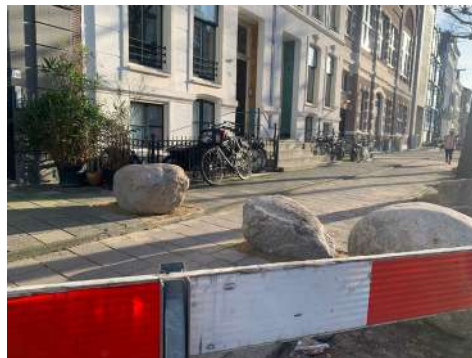
Zeer nauwe doorgang trottoir. Denk aan rolstoelen, kinderwagen, groepen.