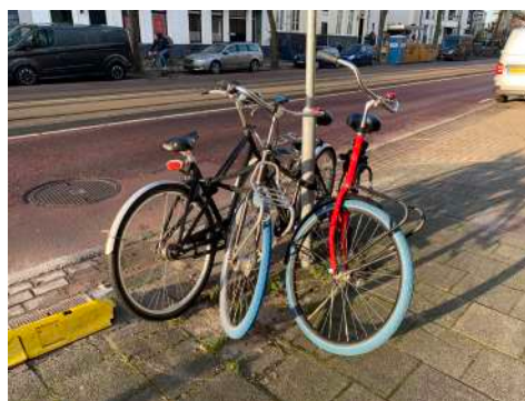
Geen plek meer voor fietsen omdat er vele nietjes zijn weggehaald aan de zijde van het NHM.