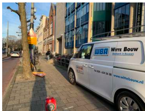
Levering voor werkzaamheden aan museum kan hier niet verder. Zwerfkeien blokkeren het trottoir.