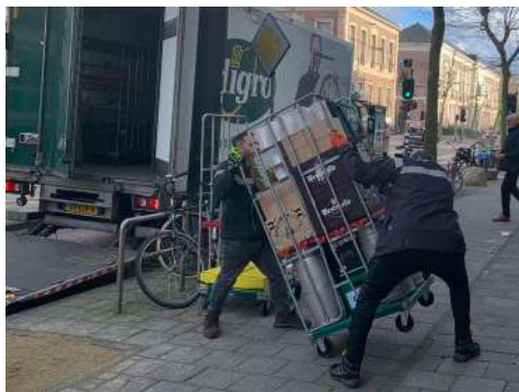
Levering goederen blokkeert vanaf nu de rijbaan. In de oude situatie konden ze de rijbaan vrijhouden.