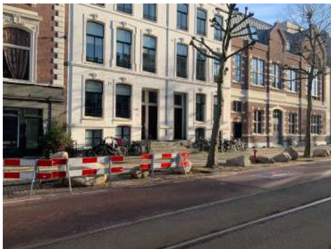
Straatbeeld vervuiling. Ingesloten panden 23 en 25, 7 woon en werk-appartementen, 16 mensen. Vrije plek voor stadsgidsen met groepen. Hangplek.