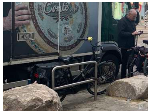
Ingesloten tussen fietsen, zwerfkeien en verkeer.