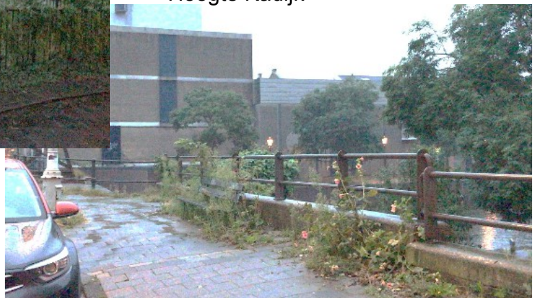
Onkruid bij Sluisbrug Hoogte Kadijk