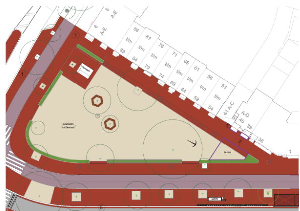
Daan en Daan voorstel terras