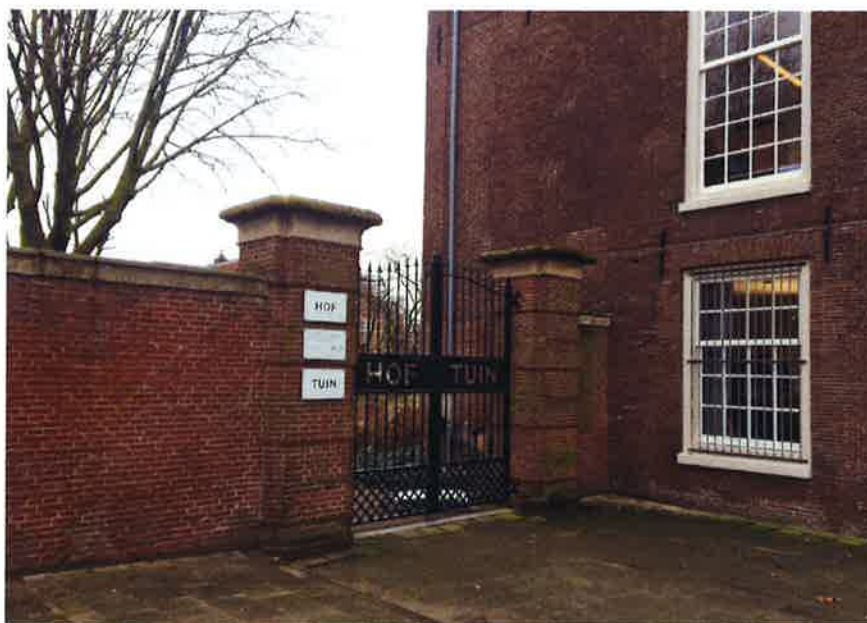
Zijingang tuin Diaconie vrijhouden

Die feiten en argumenten draagt de buurt aan, maar daarop gaat verweerder nagenoeg niet in of slechts met verdraaiing daarvan. Zo gaat het bij de ingang aan de noordzijde niet zozeer om de afstand tussen de fietsnietjes en de ingang van het Namenmonument (volgens verweerder ongeveer drie meter), maar om de vraag of die fietsnietjes de doorstroom niet belemmeren. Die doorstroom betreft ook de toegang tot de Hoftuin. Als gezegd, neemt een geparkeerde fiets ongeveer 1.75 meter in en moet voor een fietsnietje met (vaak dakpansgewijs geparkeerde) fietsen ongeveer 2 meter worden aangehouden. Dit betekent dat de fietsnietjes aan de noordzijde, zoals voorzien op de tekening 6 van bijlage 2 bij het verweerschrift, de ingang van de Hoftuin blokkeren. Dat is onveilig en ook nog eens in strijd met de randvoorwaarden uit de Haalbaarheidsstudie, zoals onderstaande foto van de huidige situatie laat zien (p. 26 Haalbaarheidsstudie, "Zijingang tuin Diaconie vrijhouden"):