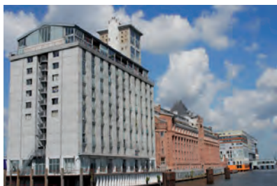
0901 Van Diemenstraat Noord/Silodam