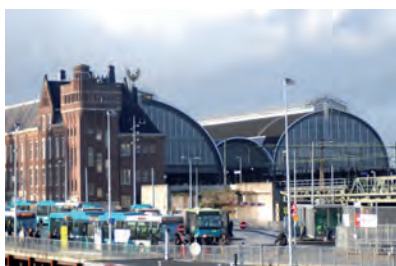
0903 Station, KvKstrook Piet Hendrik