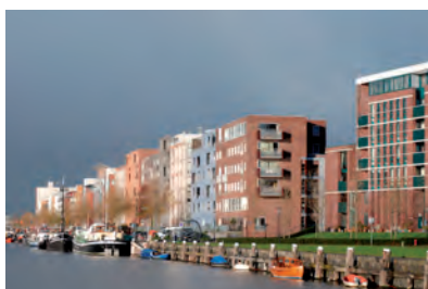
0908 Java-eiland + kop Java-eiland