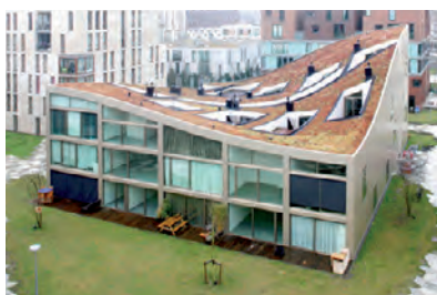
0909 Het Funen