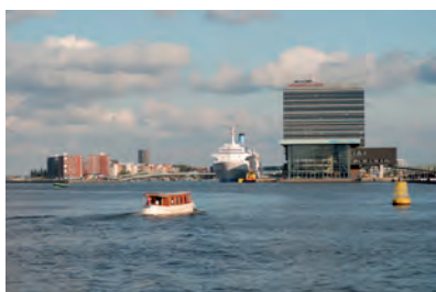
0904 Oostelijke Handels- kade/Oosterdok