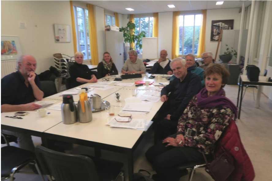
Vergadering Commissie van Toezicht 3 mei 2017 met oude en nieuwe leden

In de vergadering van 3 mei stonden ter bespreking: