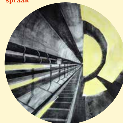
Maker: Anna van Praag Titel: De Noord-Zuidlijn

Open: bij expositie op vrijdag t/m zondag 13:00 tot 18:00, en op afspraak