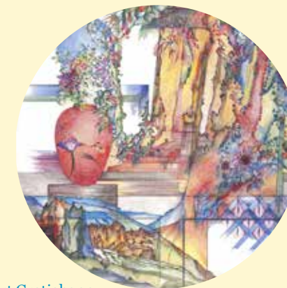
Maker: Bert Grotjohann

Open: dinsdag t/m vrijdag van 11:00 tot 16:00, zaterdag van 12:00 tot 16:00