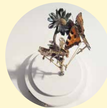
Maker: Leon van Opstal Titel: Kleine Vos

Open: donderdag t/m zaterdag van 13:00 tot 18:00, en op afspraak